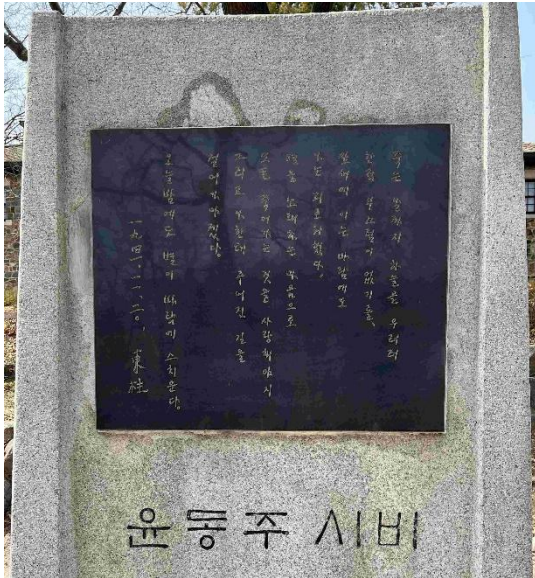
ユン・ドンジュ詩碑