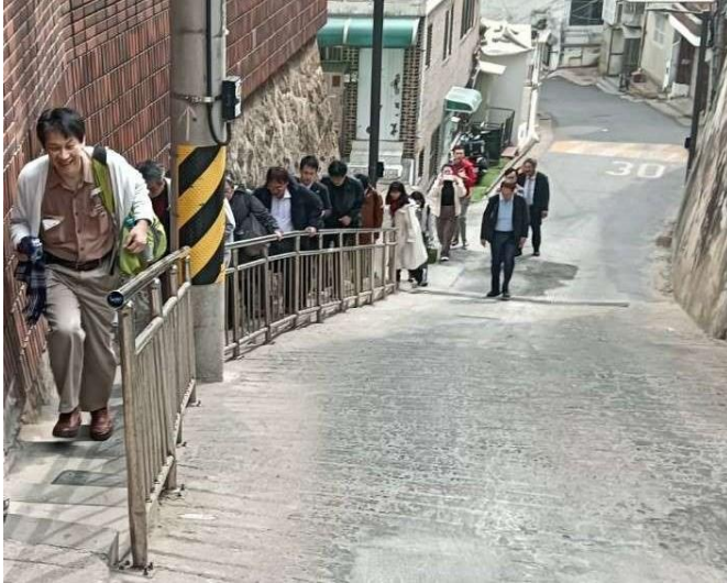
急な上り坂を登り、植民地歴史博物館へ至りました

実は、植民地歴史博物館に至るまでに、ものすごく急な坂を登らなければならず、かなり大変だったのですが、頑張って坂を登った甲斐が十分にあったと思いました。