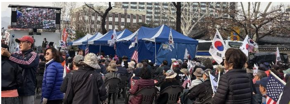
右派（ユン大統領弾劾反対派）による集会

3月24日(月)、金浦空港に到着し、スーツケースを持ったまま、直接、憲法裁判所へ向かいました。夕方ころ、憲法裁判所の近くに到着すると、右派（ユン大統領弾劾反対派）による大規模な集会が行われていました。