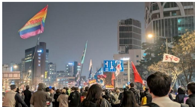
左派（ユン大統領弾劾賛成派）によるデモ行進

LAZAKとの交流会の後、クァンファムン（광화문、光化門）付近で、左派（ユン大統領弾劾賛成派）のデモに参加しました。両側6車線ぐらいの大通りで見通しが良いのに、あまりに人が多すぎて全体が見渡せないぐらいのデモ行進で、昼間に見た右派の集会を圧倒する大規模なデモでした。ユン大統領を罷免すべきだという人々がこんなに多く