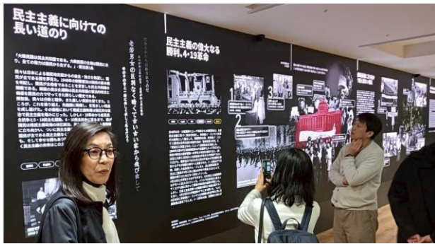
リニューアル・オープン予定の民主化運動記念

その後、民主化運動記念館としてリニューアル・オープンされる予定の新しい別館に行きました。ここでは、民主化運動の歴史が、順を追って、大きな画面で展示されていました。大きな画面を日本語表示に切り替えることもできるようになっていました。