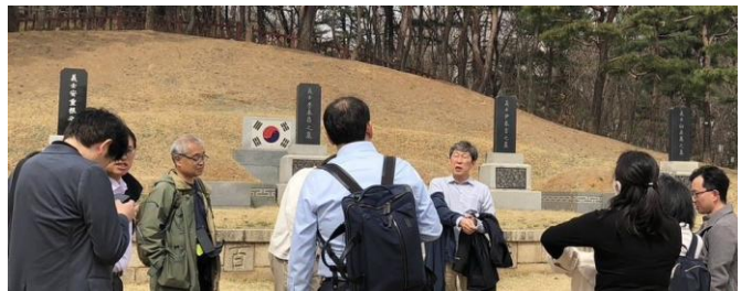
三義士の墓と安重根の仮墓（ヒョチャン公園内）