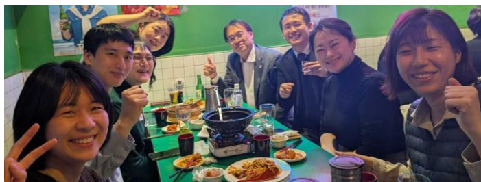
民弁との懇親会（3月25日(火) 23時ころ）

女性弁護士のうち1人は、5年前に弁護士になって、今年の1月に独立開業した（事務所に弁護士が7人いるけれども会計は独立で経費分担）ところ、弁護士としての一般的な仕事が全然なくて（ほとんどお客さんがいない）、民弁の活動とか、性暴力相談所で性暴力被害者のための活動（ほぼボランティア）ばかりしていて、今のところ経営が成り立っていないという、日本の弁護士からもよく聞くような話をしていました。韓国も、弁護士が急激に増えて、仕事の取り合いになっているようです。